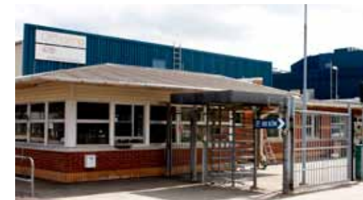
QPHARMA. Malmö. Läkemedelsfabrik som bygger ut. Har sitt ursprung i Malmöföretaget Ferrosan.