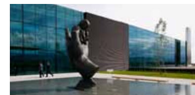
HUVUDKONTORET I ST-PREX, SCHWEIZ. Invigdes 2006 men redan 2004 hade huvudkontoret flyttat från Ørestad till hyrda lokaler i Schweiz.

”Den absolut största delen av det Ferring tjänar går tillbaka till företaget. Och av det som vi tar ut går den absolut största delen tillbaka till filantropiska aktiviteter”