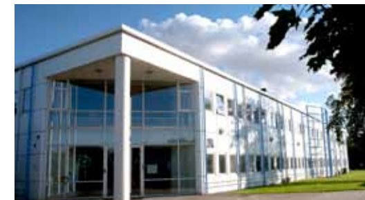
NORDIC DRUGS. Limhamn. Marknadsföringsbolag som bl.a. säljer "speciality pharma" under egna och andras varumärken.