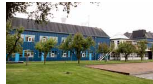
POLYPEPTIDE GROUP. Limhamn. Råvaruproducerande läkemedelsfabrik i Limhamn som tidigare tillhört Ferring.